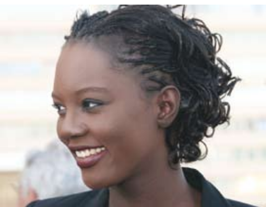
השרה הצרפתית ראמה יאד בתערוכה "קריטורות למען השלום" בירושלים Rama Yade en visite en Israël pour l'exposition "Cartooning for Peace"