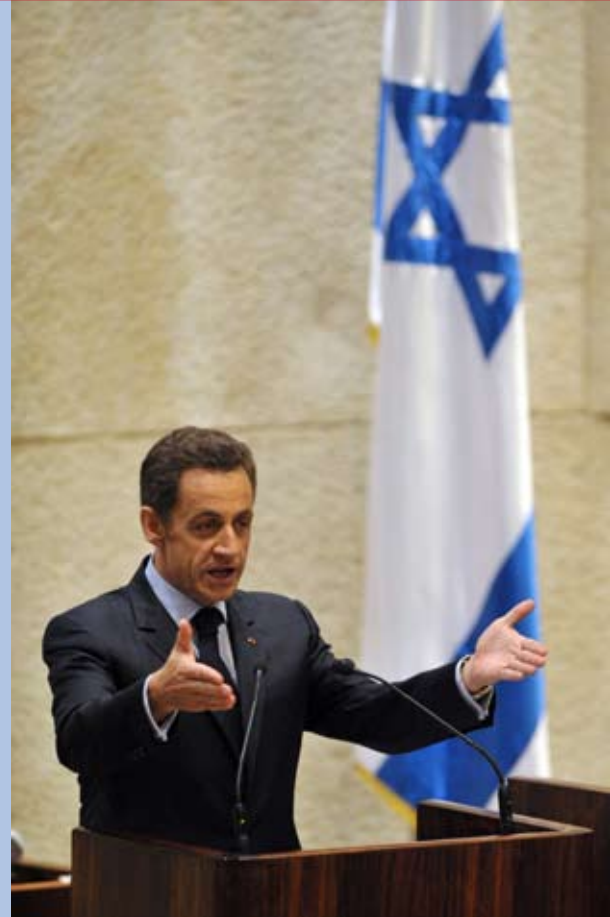
הנשיא סרקוזי נואם בפני מליאת הכנסת, 23.6.08

"נכון שלא ייתכן שלום תחת איום הטרור. לא תיתכן הכרה הדדית כאשר רקטות פוגעות מדי יום בקורבנות חפים מפשע. אבל צריך אומץ לומר גם שלא ייתכן שלום גם מבלי הפסקה מוחלטת ומיידית של הבנייה בהתנחלויות. לא ייתכן שלום אם הפלסטינים לא ילחמו בעצמם בטרור. לא ייתכן שלום אם יימנע מהפלסטינים לנוע או לחיות בשטחם. לא ייתכן שלום מבלי שתיתפר בעית הפליטים הפלסטינים תוך כיבוד הזהות וייעודה של ישראל. לא ייתכן שלום מבלי הכרה בירושלים כבירתן של שתי מדינות והבטחת חופש הגישה למקומות הקדושים לכל הדתות. לא ייתכן שלום ללא גבול מוסכם על בסיס קווי 67 וחילופי שטחים שיאפשרו לבנות שתי מדינות בנות-קיימא".